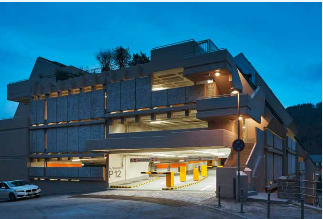
Parkhaus Kornmarkt/Schloss (P12) in der Heidelberger Altstadt: Frisch saniert