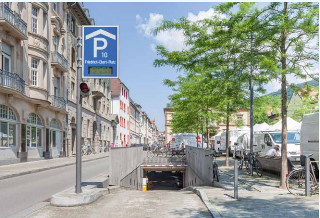
Parkhaus am Friedrich-Ebert-Platz (P10): Unser modernstes

Die Stadtwerke Heidelberg Garagen haben mehr als 35 Jahre Erfahrung mit dem wirtschaftlichen Betrieb von vier eigenen Parkhäusern und vier Anwohnergaragen sowie Betriebsführungen von weiteren Parkhäusern in Heidelberg und der Region. Überzeugen Sie sich selbst und besuchen Sie eines unserer Referenzobjekte.