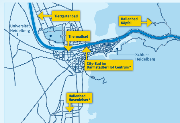
* nur in der Wintersaison geöffnet

Fünf Bäder laden in Heidelberg zum Bewegen und Erholen ein: das ganzjährig geöffnete Hallenbad Köpfel in Ziegelhausen, die Hallenbäder City-Bad im Darmstädter Hof Centrum und Hasenleiser und die Freibäder Tiergarten- und Thermalbad.