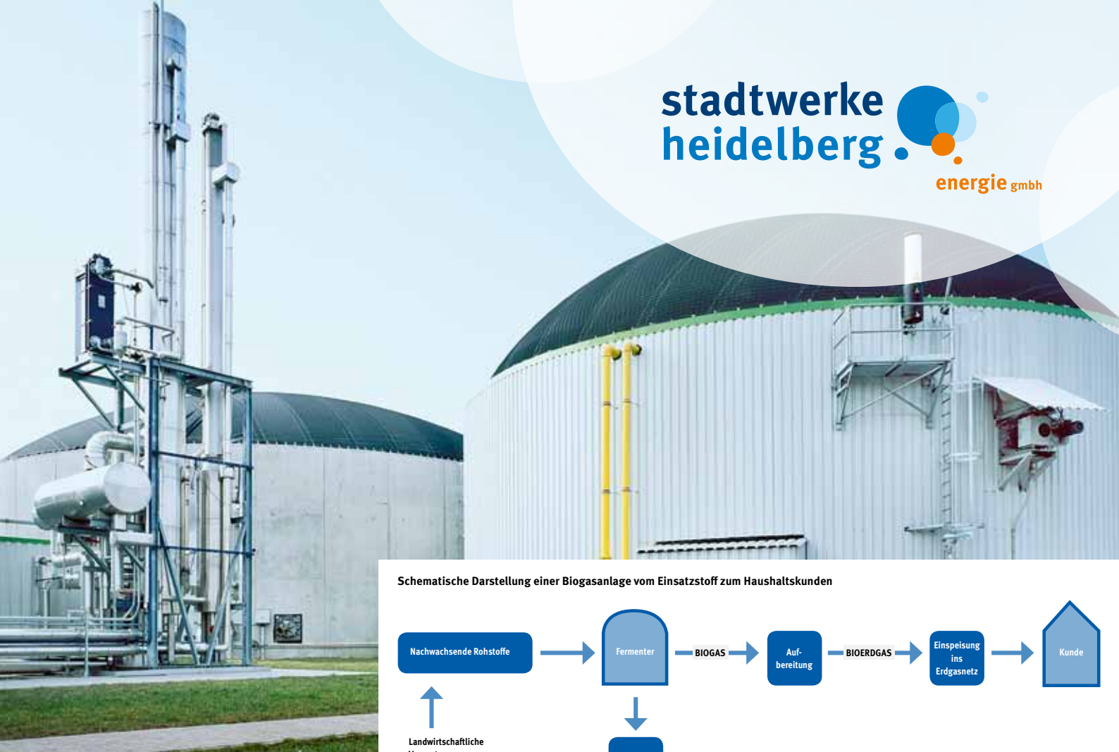
Schematische Darstellung einer Biogasanlage vom Einsatzstoff zum Haushaltskunden